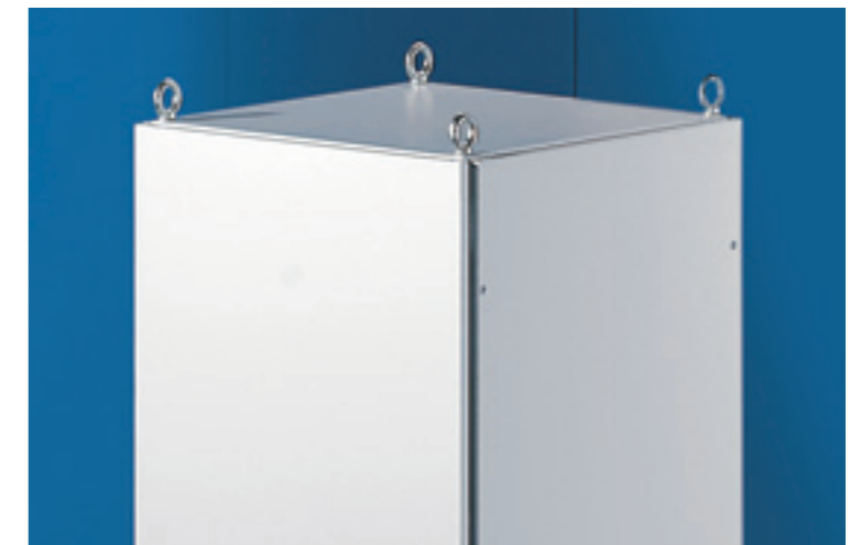
Extrem standfest: Gehäuse aus Stahlblech, Alu-Zink beschichtet und pulverlackiert

Diese dreifache Behandlung der Oberfläche sorgt für einen optimalen Korrosionsschutz – Rittal Produkte werden damit beständiger gegen Mineralöle, Schmierstoffe, Bearbeitungsemulsionen, Lösungsmittel und viele weitere potenziell schädliche Umwelteinflüsse am Einsatzort.