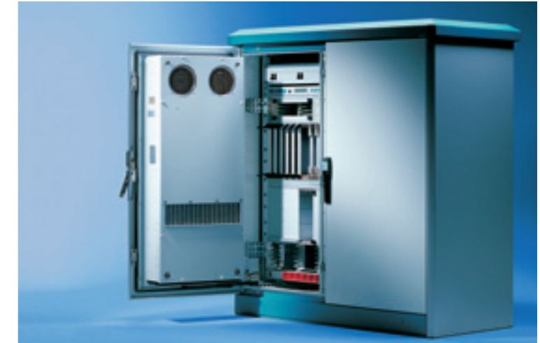
Extrem gut geschützt: Outdoor Gehäuse mit Zinkphosphatisierung